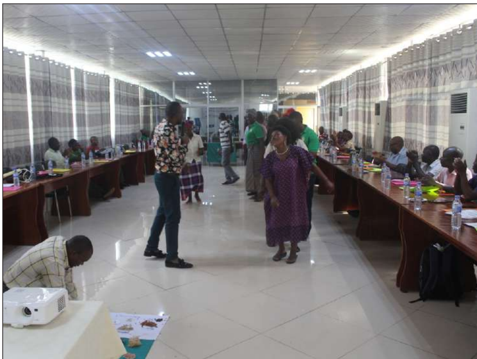
Parte dos participantes, em momento de descontração.