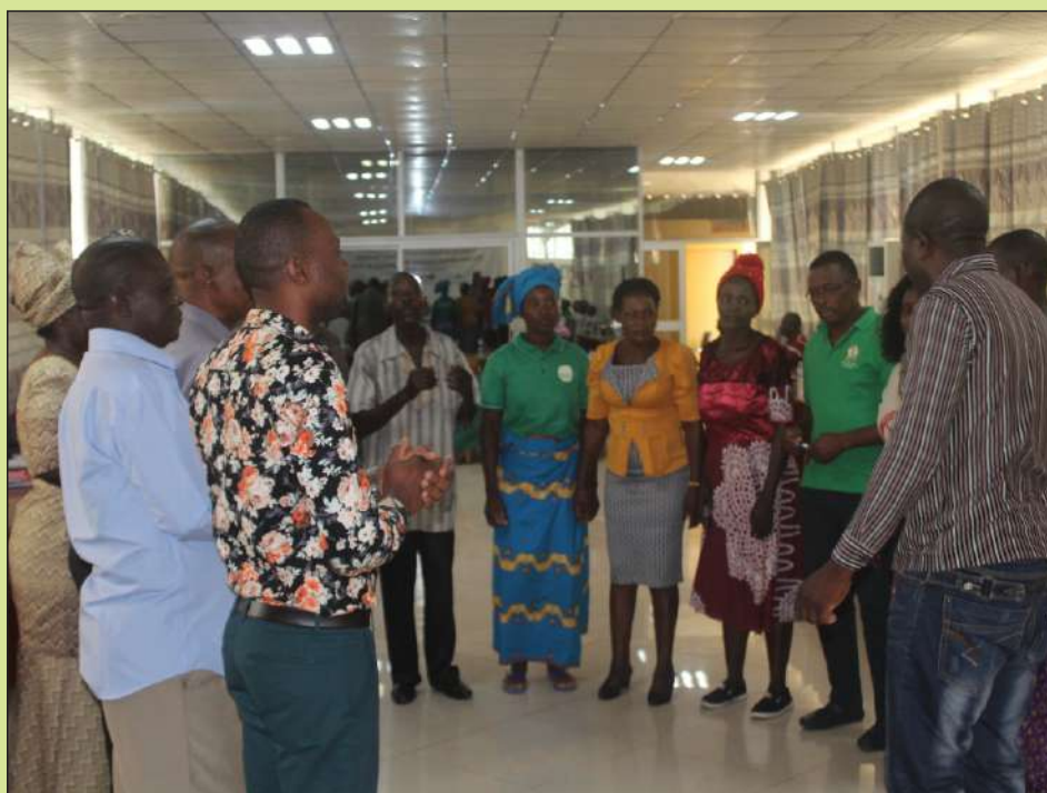
Participantes da Conferência, cantando e dançando.

efectiva posição, naquele mecanismo; e que logo depois, haveria uma concertação interna, a nível do movimento, sobre o assunto.