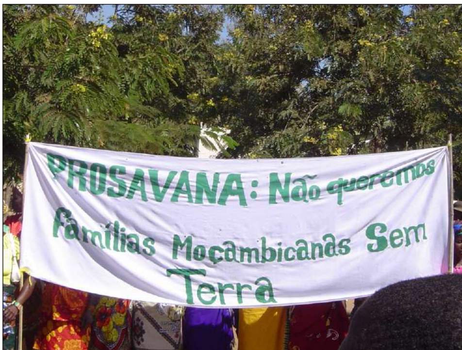
“Não queremos famílias moçambicanas sem terra” - dizem os camponeses.

Em Abril de 2018, o então Ministro da Agricultura, Senhor Higino Marrule, reuniu-se, em Maputo, com OSC's-Organizações da Sociedade Civil, com o