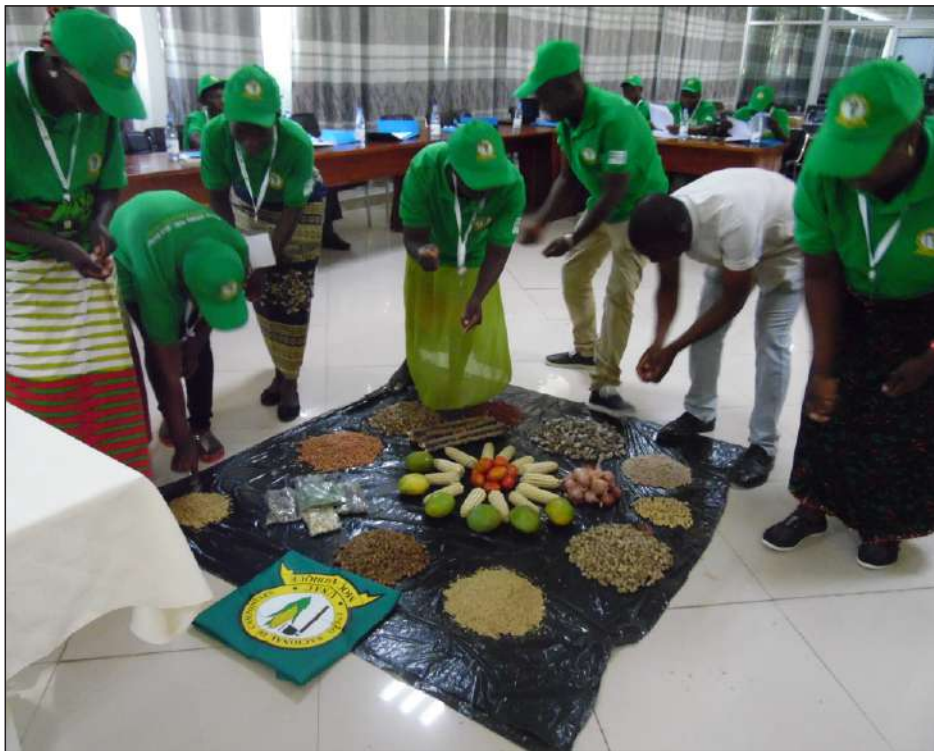
Momento de Mística, na Conferência Nacional sobre Terra e Sementes.

deixadas pelos camponeses e camponesas durante, principalmente, as Conferências Regionais sobre Terra e Sementes; actualizar a posição da UNAC em relação ao ProSavana e reflectir sobre outros desafios candentes do movimento, como por exemplo, debater sobre questões de produção e produtividade dos camponeses, e sobre o processo nacional de resgate, multiplicação e conservação de sementes locais.