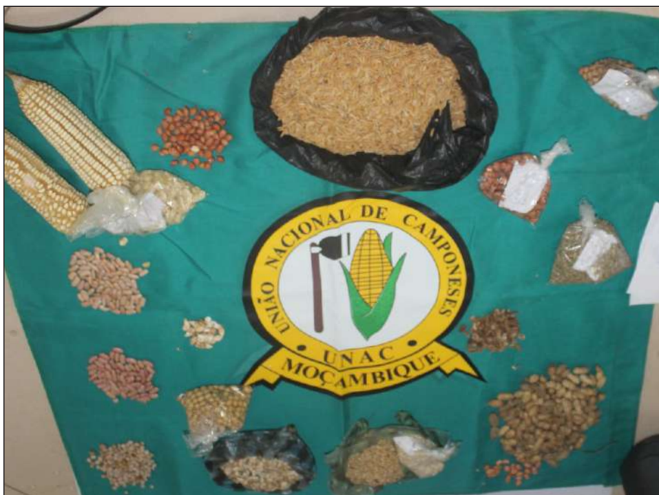
Demonstração de algumas das Sementes Nativas, que os camponeses conservam e usam.

O nosso país, nos últimos anos tem vivido cenários catastróficos, caracterizados por duas situações extremas, nomeadamente seca/